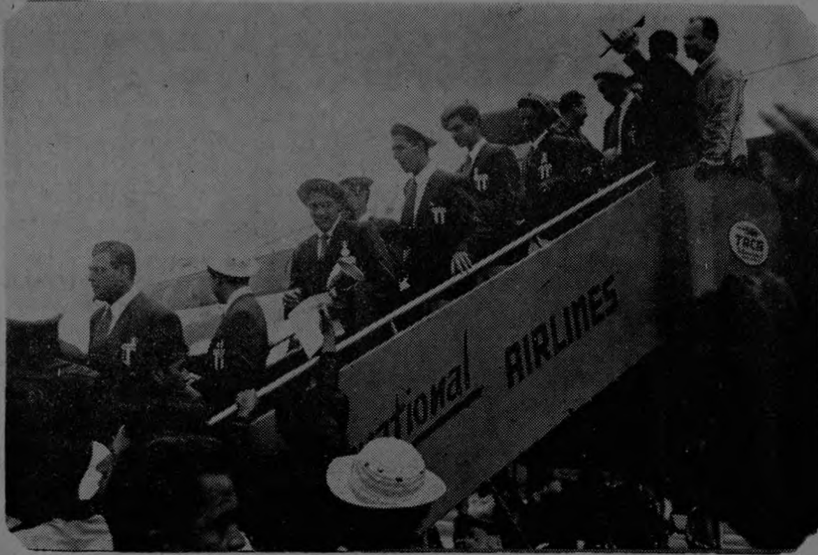
Momento en que descendían del avión de TACA los integrantes de la delegación futbolística costarricense que regresó ayer de Honduras. El público los esperó para darles la bienvenida en el propio aeropuerto de El Coco. Contentos regresaron todos de la labor cumplida.