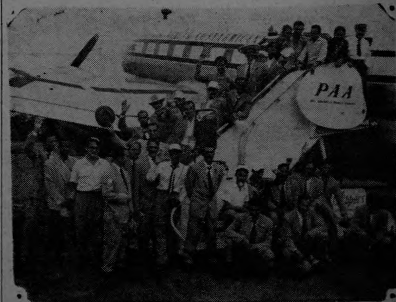
La delegación de Aruba que estuvo unos pocos minutos en el Aeropuerto Internacional de El Coco procedente de Honduras. Los arubanos se mostraron extrañados de la cantidad de público, quince mil personas, que esperaban a los Campeones Invictos del Circuito, para darles la bienvenida.